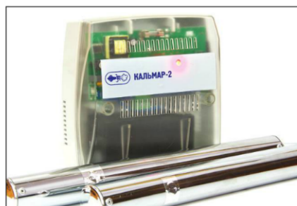
Фото 1. Базовый комплект поставки устройства подачи дыма «КАЛЬМАР-2»

В июне 2012 года компания «ТСО» (г. Ростов-на-Дону) совместно с ПО «БАСТИОН» представила систему активной защиты объекта от кражи «на рывок» — устройство подачи дыма «КАЛЬМАР-2».