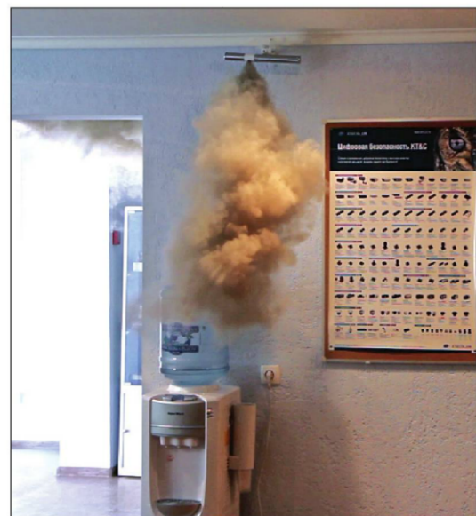
Фото 2. Выход дыма

Запуском источников дыма управляет блок электроники «Кальмар-2», который, по сути, представляет собой специализированный приемно-контрольный прибор. Блок электроники контролирует состояние двух шлейфов. К первому шлейфу подключается выход ПЦН прибора охранной сигнализации объекта, ко второму шлейфу — дополнительный извещатель. В режиме «ОХРАНА» прибор постоянно анализирует состояние первого шлейфа, а, при обнаружении срабатывания,